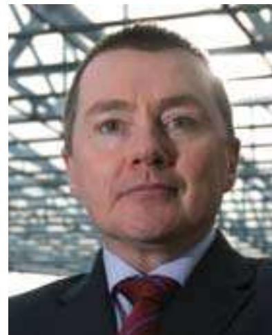
WILLIE WALSH CONSEJERO DELEGADO BRITISH AIRWAYS